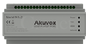
兩線 IP 交換機 NS-2

此交換機使用兩線無極性配線來提供網路通訊及電力供應的兩線IP網路交換機它提供了一種方便的方式來升級傳統模擬對講系統，無需重新佈線。