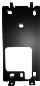
通用掛架 (訂製版隨附，其它請選購)